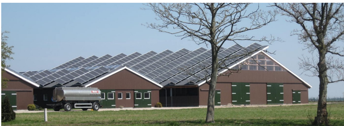
Solaranlagen auf Wirtschaftsgebäuden in Schleswig-Holstein

In meinem Wahlkreis gibt es nicht nur umstrittene Hochspannungstrassen, sondern auch ein Pumpspeicherwerk in Geesthacht, das ich im Juli erneut besuchen werde. Es bietet als einzige Einrichtung in Schleswig-Holstein die Möglichkeit, Energie für Spitzenbedarfszeiten zu speichern. Doch es kann nicht wirtschaftlich arbeiten, weil es eine sogenannte „Oberflächenwasserentnahmeabgabe“ entrichten muss, die unter Rot-Grün eingeführt wurde, weil man meinte, so das KKW Krümmel behindern zu können. Der Landtag in Kiel sollte trotz der von den Vorgängern geerbten desolaten Haushaltslage alles daran setzen, diese energiepolitisch falsche Abgabe zu beseitigen. Eine Sondersteuer auf Energieinfrastruktur ist das letzte, was wir jetzt brauchen können.