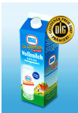
Spitzenprodukt aus Trittau

Die Meierei Trittau hat die erste Frischmilch Europas mit der verlängerten Frische von mindestens 18 Tagen ab Werk auf dem Markt gebracht - schon 1990! Sie hat als erste Meierei das Fallstromverfahren für die längere Haltbarkeit von Milchprodukten im europäischen Markt eingeführt. Von dieser langjährigen Erfahrung profitieren Handel und Verbraucher gleichermaßen.